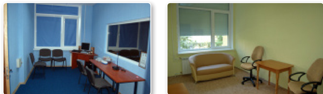
Мал. 2. Дружня кімната до дитини.

Є приклади, коли подібні кімнати розташовані в приміщеннях служби у справах дітей. Так, у Болгарії така кімната була відкрита у 2008 році при центрі надання соціальних послуг у місті Пазарджік. В Україні показовим прикладом може слугувати кімната, обладнана на базі притулку для дітей служби у справах дітей у м. Києві. Відкриття кімнати стало можливим завдяки проекту «Впровадження пілотної моделі структурної профілактики насильства щодо дітей», що впроваджувався Українським фондом «Благополуччя дітей» у партнерстві з Міністерством України у справах сім'ї, молоді та спорту, Київською міською службою у справах дітей, Київським міським центром соціальних служб для сім'ї, дітей та молоді тощо за підтримки міжнародної організації «Brot für die Welt» (Німеччина). Приміщення отримало назву «Дружньої кімнати», облаштоване за відповідними європейськими стандартами та рекомендаціями роботи з дітьми. Організація кімнати (окремі приміщення для опитування та для спостереження за дитиною спеціалістами (співробітники кримінальної міліції у справах дітей, суддями та ін.), віденське дзеркало, система комунікації між кімнатами, відео- та аудіозапису опитування, зручні меблі для дітей і дорослих, іграшки) сприяє створенню комфортної та безпечної атмосфери для дитини.