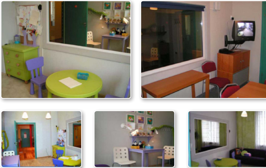
Мал. 3. Кімната для опитування дітей в Центрі захисту дітей «Mazowiecka» (Фундація «Нічії діти», Польща)

У низці країн спеціальні кімнати для опитування дітей працюють на базі неурядових організацій. Наприклад, у Молдові для опитування дітей використовується кімната на базі неурядової організації «Ла Страда-Молдова», а в Польщі – при благодійному фонді «Нічії діти», а також на базі соціальних служб та Центру захисту дітей (мал. 3).