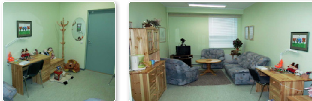
Мал. 1. Кімнати для опитування дітей в Естонії.

для опитування дитини, зокрема, анатомічні ляльки, малюнки, тести, опитувальники. За законодавством Естонії, у допиті дітей до 14 років завжди беруть участь працівники служби допомоги жертвам чи свідкам насильства.