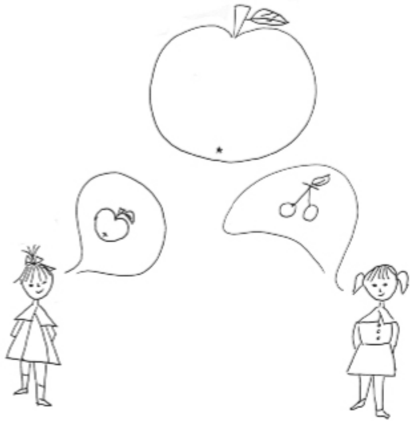
Малюнок, що допомагає дитині розрізняти правду та обман.